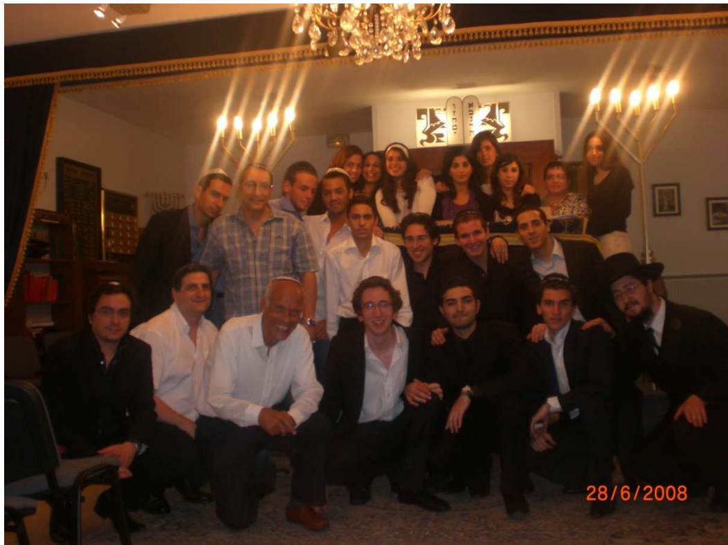
L'équipe du Chabath Plein d'Angers